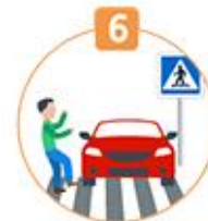
6 횡단보도 보행자 보호 위반