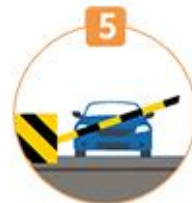
5 철길건널목 통과방법 위반