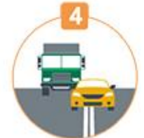
4 앞지르기 위반