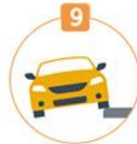
9 보도 침범