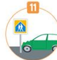
11 어린이 보호구역 안전운전의무 위반