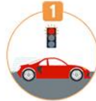
1 신호 위반