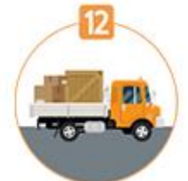
12 화물고정조치 위반