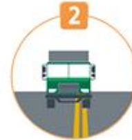
2 중앙선 침범