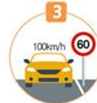
3 속도위반 (제한속도보다 20km/H 이상 과속)