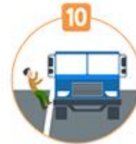
10 승객 추락방지 의무 위반