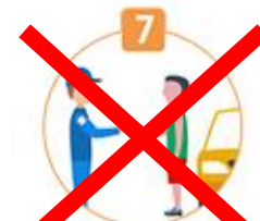
7 무면허 운전