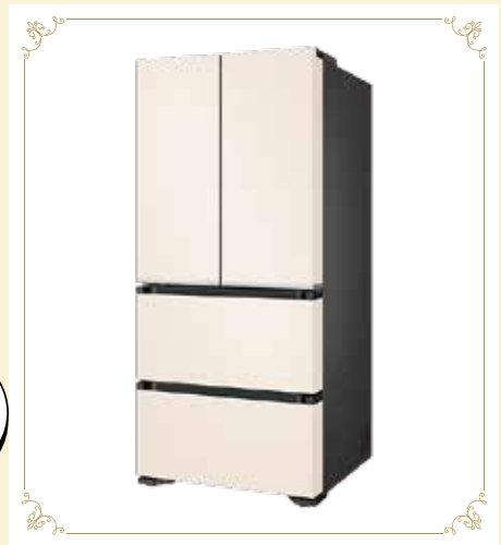
하이마트 쇼핑몰 모델명 : RQ49C90X24E 비스포크 김치냉장고4도어 매트 크림미 베이지