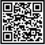
인터뷰 영상 플버전 보러가기