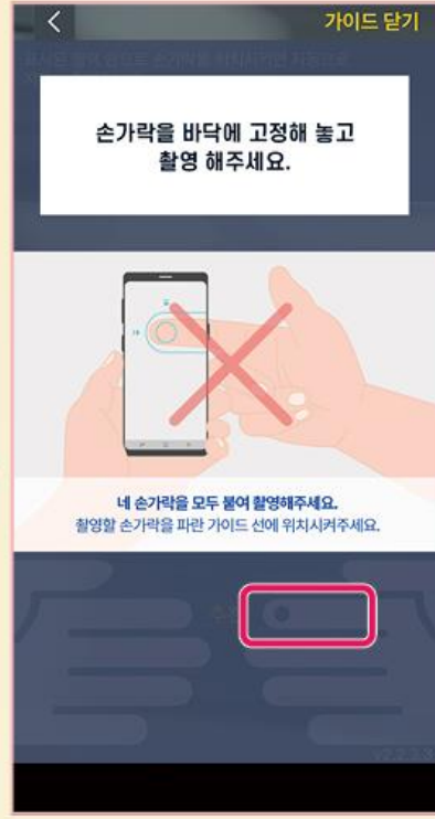
별첨2 피보험자의 지문 촬영 네 손가락모두보이게 촬영