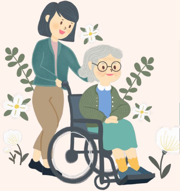
출처 : 국민건강보험공단, 2021 노인장기요양보험 통계연보