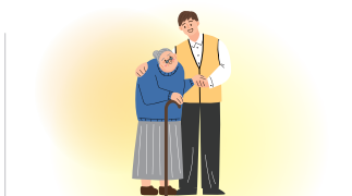
만 65세 이상 금융소비자