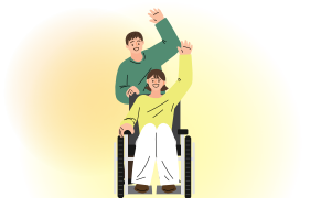
장애인 복지법 등 관련법 상의 장애인

금융상품 가입 및 이용에 어려움이 있는 금융소비자로 장애인, 고령층, 외국인 등을 말합니다.