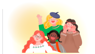
의사소통이 어려운 외국인