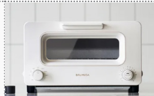
발뮤다 더 토스터 (30만원 상당)