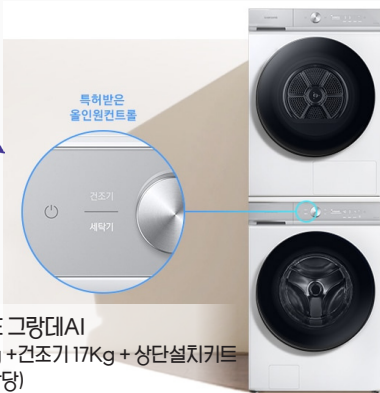
BESPOKE 그랑데이 세탁기 21Kg + 건조기 17Kg + 상단설치키트 (200만원 상당)