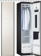
LG스타일러 (150만원 상당)