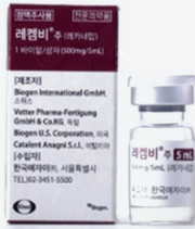
표적치매치료제 레캄비 24년 11월 출시