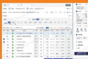
② 가입 설계 단계