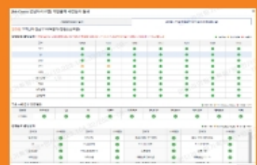
③ 선심사 판단결과 단계