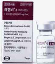
표적치매치료제 레캄비 24년 11월 출시